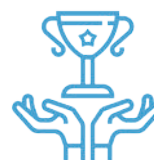
Préparation à l'oral d'admission