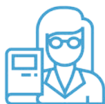
Matières de l'option Santé et des licences

Afin de maximiser vos chances d'intégrer les études de santé, nous vous accompagnons sur les matières de l'option Santé, les enseignements transversaux et ceux de la licence choisie. Nous vous proposons également une Pré-rentrée qui vous permettra de démarrer sereinement et efficacement votre année.